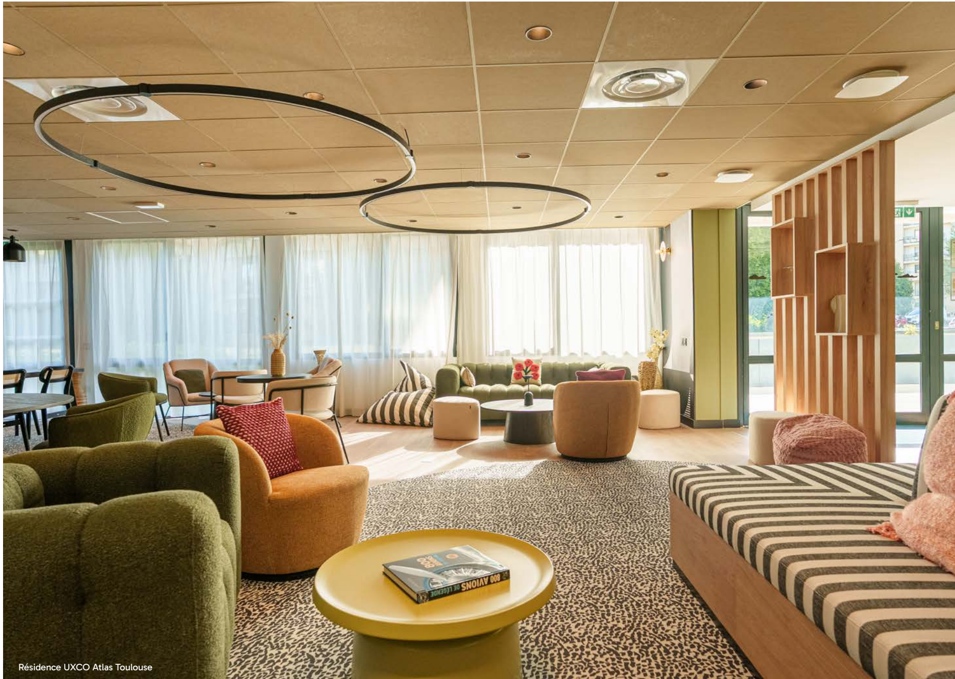
Résidence UXCO Atlas Toulouse